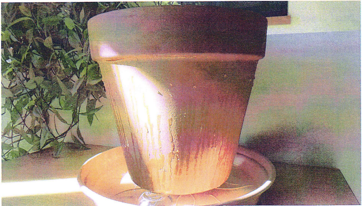
Diffusion lente grâce à la porosité de la céramique remplie d'eau